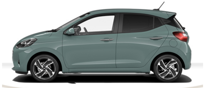
Abbildung ist als unverbindlich zu betrachten. Fahrzeugabbildungen enthalten z. T. aufpreispflichtige Sonderausstattungen.